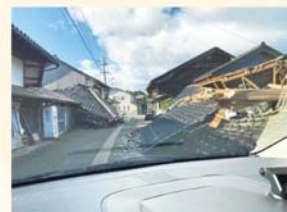
1月4日 石川県七尾市において

「地域力cafe」を開催します👉 自分たちが暮らすまちの未来について共にお話しませんか。市民みんなで考え、より良い市民の拠点づくりへの意見を鎌倉市政へとつなげてまいります。