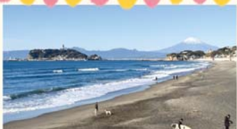
由比ヶ浜から見た七里ガ浜海岸

1 極楽寺川清掃 日時：令和6年2月18日(日) 9時～ (1時間程度・雨天中止) 集合：稲村ガ崎自治会館前(稲1-15-32) 持物：長靴、手袋等